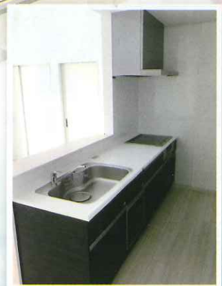
*写真はイメージ合成を含みます。