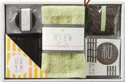
竹炭石鹸・竹炭袋・入浴料 フェイスタオル・竹炭板×2・竹炭板用ネット