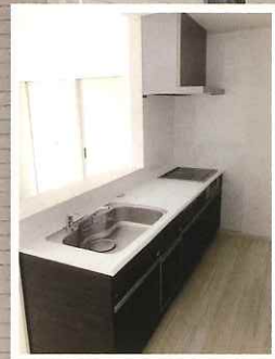
*写真はイメージ合成を含みます。